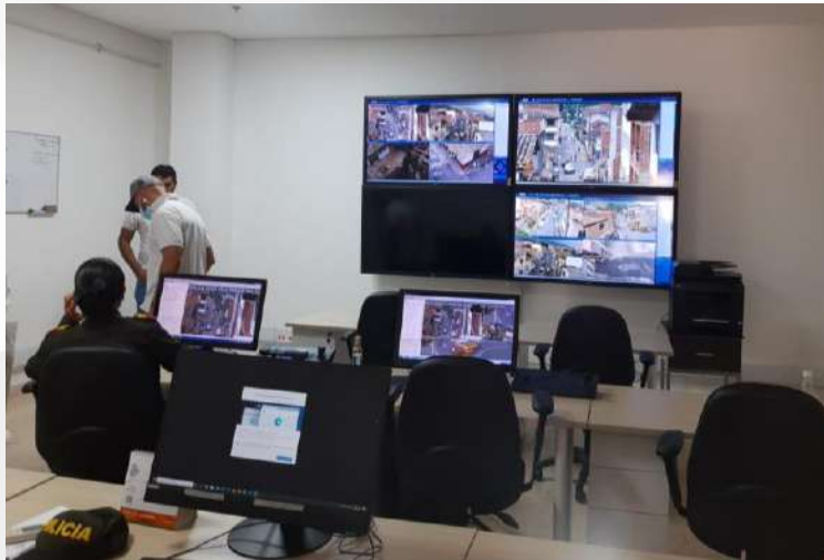
• CCTV La Estrella

En el año 2022, logramos llevar nuestros servicios a diferentes municipios del Oriente antioqueño como Guarne , La Ceja y por supuesto Rionegro. En el Valle de Aburrá desarrollamos proyectos en Envigado, La Estrella, Bello y Sabaneta, y en otras entidades tanto públicas como privadas como la FLA y Devimed.