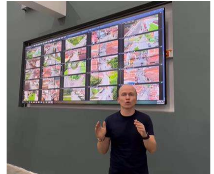
CCTV La Ceja •