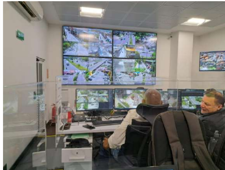
• CCTV Envigado