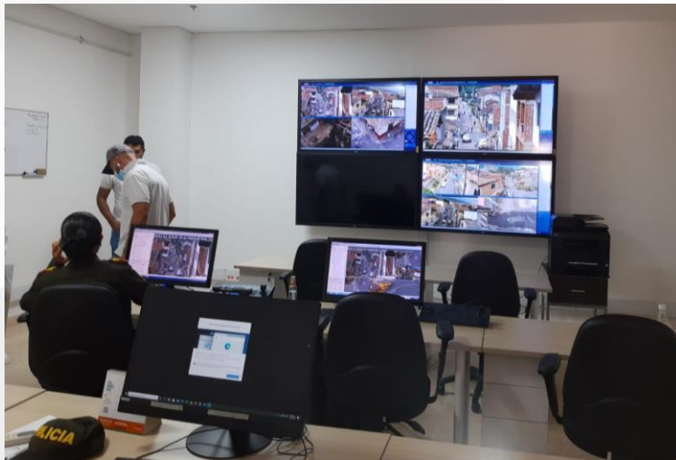
• CCTV La Estrella

En el año 2022, logramos llevar nuestros servicios a diferentes municipios del Oriente antioqueño como Guarne , La Ceja y por supuesto Rionegro. En el Valle de Aburrá desarrollamos proyectos en Envigado, La Estrella, Bello y Sabaneta, y en otras entidades tanto públicas como privadas como la FLA y Devimed.