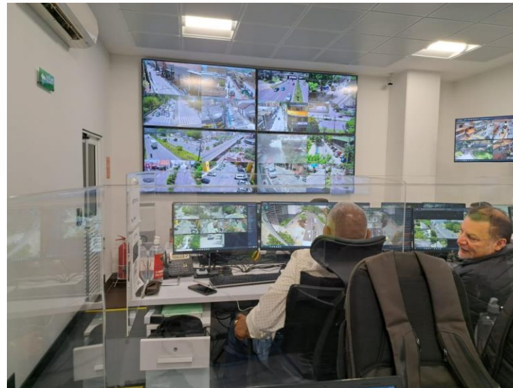
• CCTV Envigado