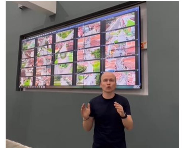
CCTV La Ceja •